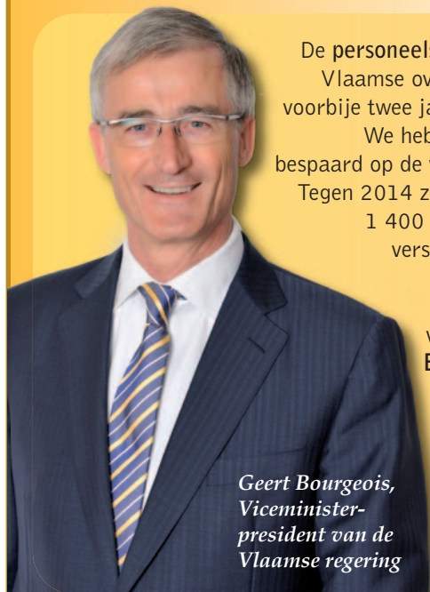
Geert Bourgeois, Viceminister- president van de Vlaamse regering

De personeelsbudgetten van de Vlaamse overheid daalden de voorbije twee jaar met 5 procent. We hebben ook drastisch bespaard op de werkingsmiddelen. Tegen 2014 zullen er bovendien 1 400 ambtenaren op de verschillende Vlaamse departementen niet stelselmatig vervangen worden. Een besparing van 50 miljoen euro per jaar!