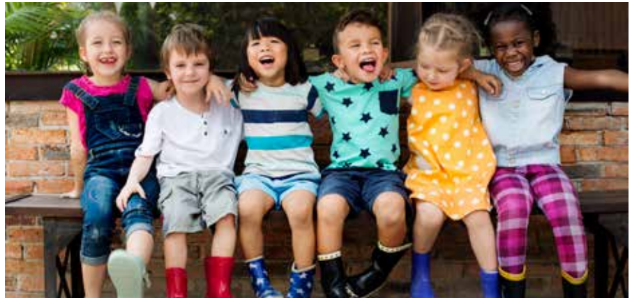
▲ Dankzij Vlaamse steun kan Dilbeek de komende jaren extra taalstimulerende projecten organiseren.

Dilbeek krijgt 45.950 euro van Vlaams Onderwijsminister Ben Weyts voor het taalstimulerende project 'Dilbeek + taal = sterk verhaal!'. Daarnaast krijgen ook de kampen van Sportjeslim vzw extra ondersteuning.