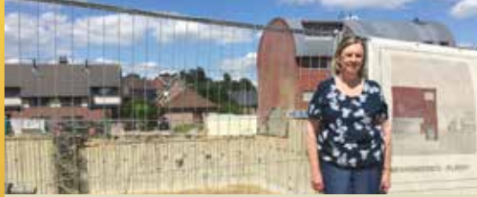
Spades in de grond (p. 4)