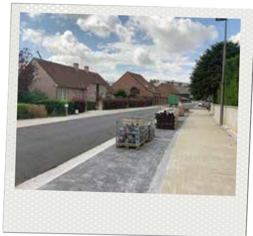
▲ De Roelandsveldstraat en de Tennislaan werden volledig vernieuwd.