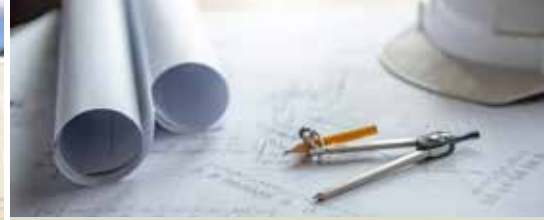
Bouwpauze voor meergezinswoningen (p. 5)