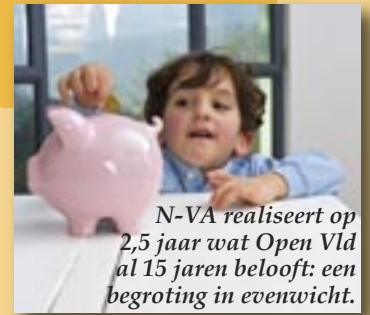
N-VA realiseert op 2,5 jaar wat Open Vld al 15 jaren belooft: een begroting in evenwicht.

Tot spijt van wie 't benijdt, want onder meer Open Vld spaarde haar kritiek niet maar ziet intussen 'groen' van jaloezie. Begrijpelijk: de N-VA realiseert op 2,5 jaar wat Open Vld al 15 jaren belooft!