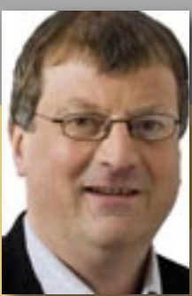
Willy Segers Vlaams volks- vertegenwoordiger